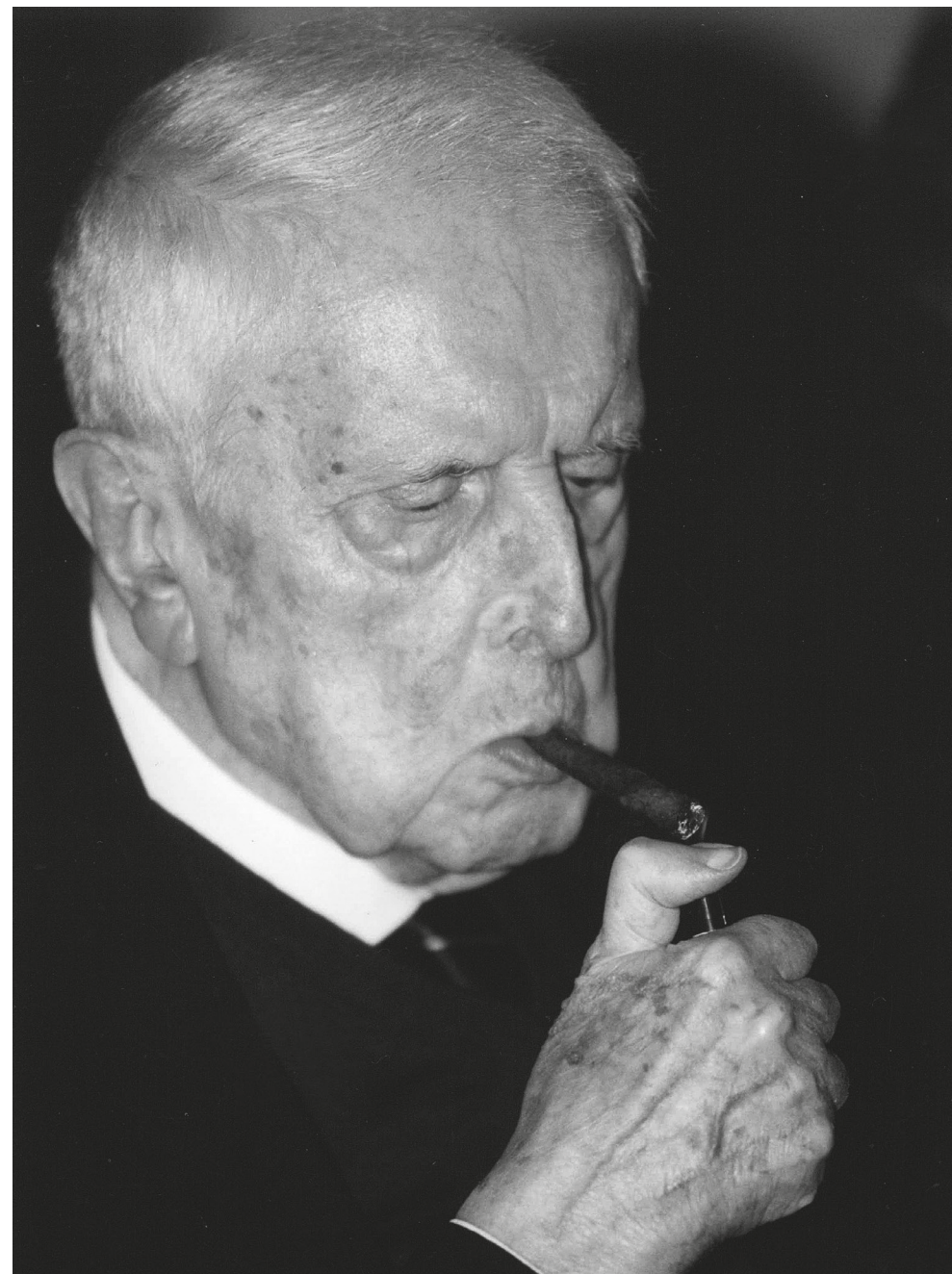
Carlo Bo, Premio nazionale da Fabriano - III edizione - 23 ottobre 1999